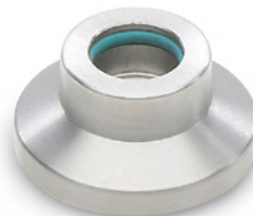
Информация по монтажу

- Характеристики нержавеющей стали (см. стр. A26)