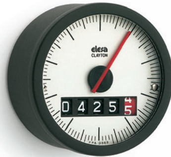
ELESA Original design

Для выбора маховика см. таблицу «Возможная сборка маховиков/ручек с индикаторами» (на стр. 961).