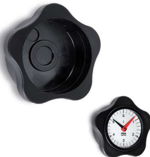
ELESA Original design