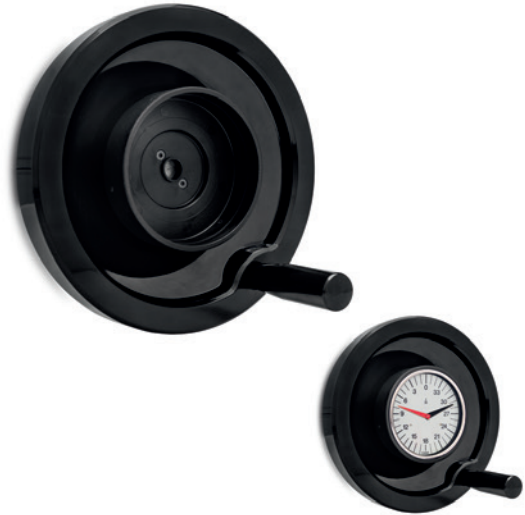
ELESA Original design

Исполнение с ручным сбросом: считывание показаний индикатора может быть сброшено в любом положении в диапазоне расположения, так чтобы дальнейшие показания могли быть соотнесены с точкой сброса. Для сброса показаний поворачивайте корпус индикатора, пока два указателя не достигнут нулевого положения при сохранении неподвижности положения корпуса индикатора. Таким образом, соответствующее положение (фаза) между индикатором и маховиком может быть изменено применением небольшого усилия, но достаточного, чтобы избежать любого случайного смещения фазы.