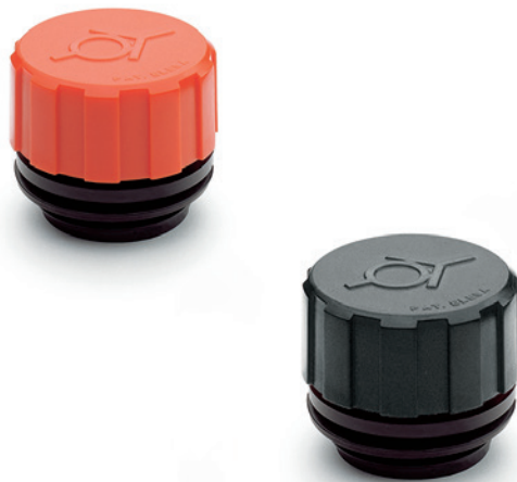
ELESA Original design

Клапанные крышки с сапуном SFV, особенно подходят для всех тех видов применения (редукторы, вариаторы или компрессоры), где внутреннее давление воздуха не должно превышать определенного значения (10 или 100 мб). В этих случаях, предохранительный клапан крышки позволяет изгнание чрезмерного воздуха в резервуаре, таким образом, восстанавливая значения давления, для которых клапан установлен. Сальник (закрытый в нормальных условиях давления) предотвращает попадание пыли и потери масла.