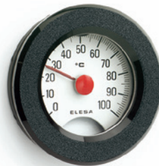
ELESA Original design