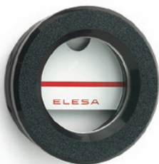
ELESA Original design

Закруглите отверстие 1x45° и слегка смажьте наружную поверхность кольцевого уплотнения для облегчения монтажа.