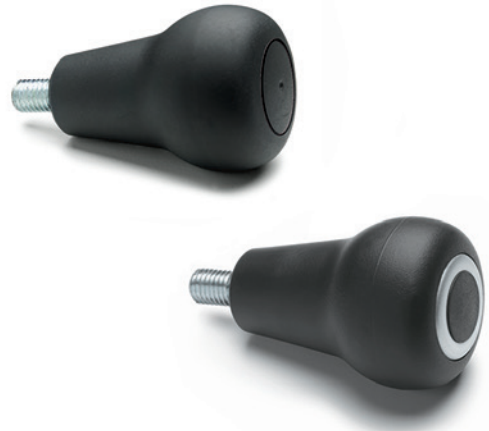
ELESA Original design

IEL+x-H: с увеличительными линзами для этикеток со знаками и символами.